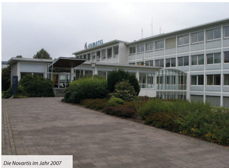
Die Novartis im Jahr 2007