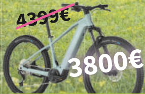
Bergamont E-Revox Sp. 10