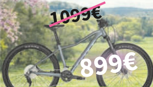
Scott Contessa Active 10