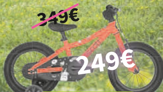
Scott Contessa 14

Friedrichstraße 4a - 79664 Wehr www.biketool.info