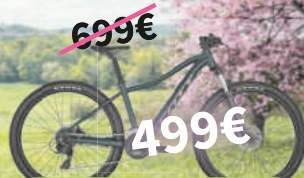
Scott Contessa Active 50