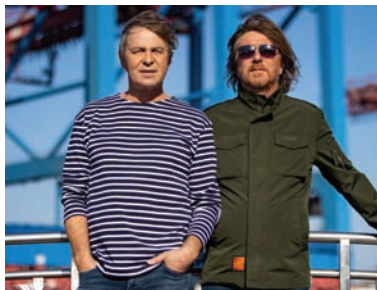
Fools Garden