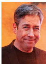
Hormuth © Kaiser Schaefer fotoworks